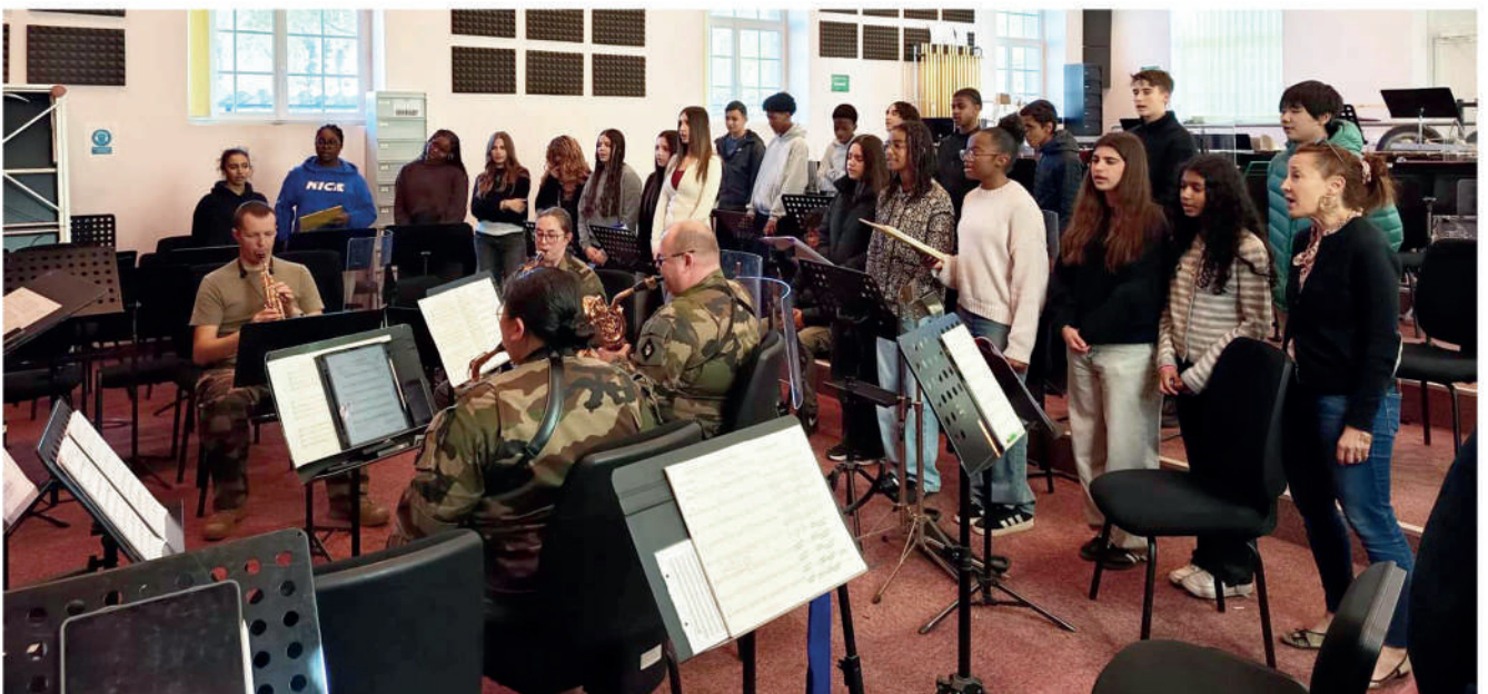
Séance de chant et répétition avec la Musique des troupes de Marine