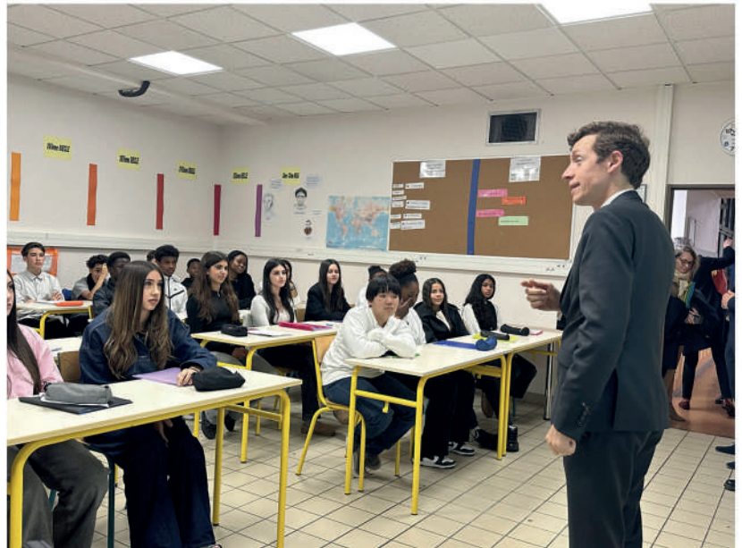
Visite du Mont Valérien et visite du Ministre au collège Debussy