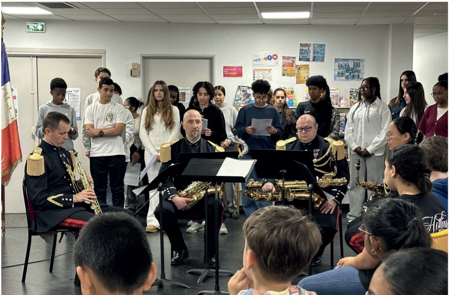
Cérémonie d'hommage et de commémoration à la mémoire de Marc Bloch au collège, le 19 mai 2026