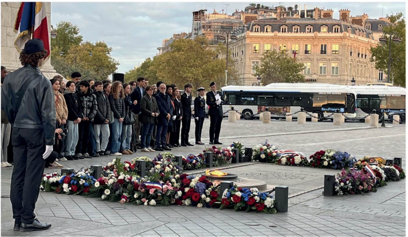
Cérémonie du ravivage de la flamme / Arc de Triomphe